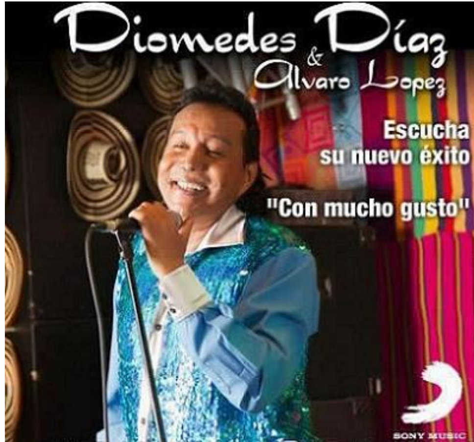
Diomedes Díaz canta “Con mucho gusto”