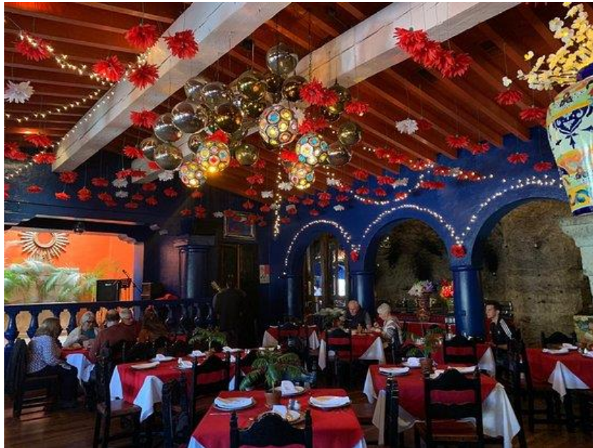
La Roca Restaurante Nogales, SN

Link for sign-up sheet will be provided with next week's class email